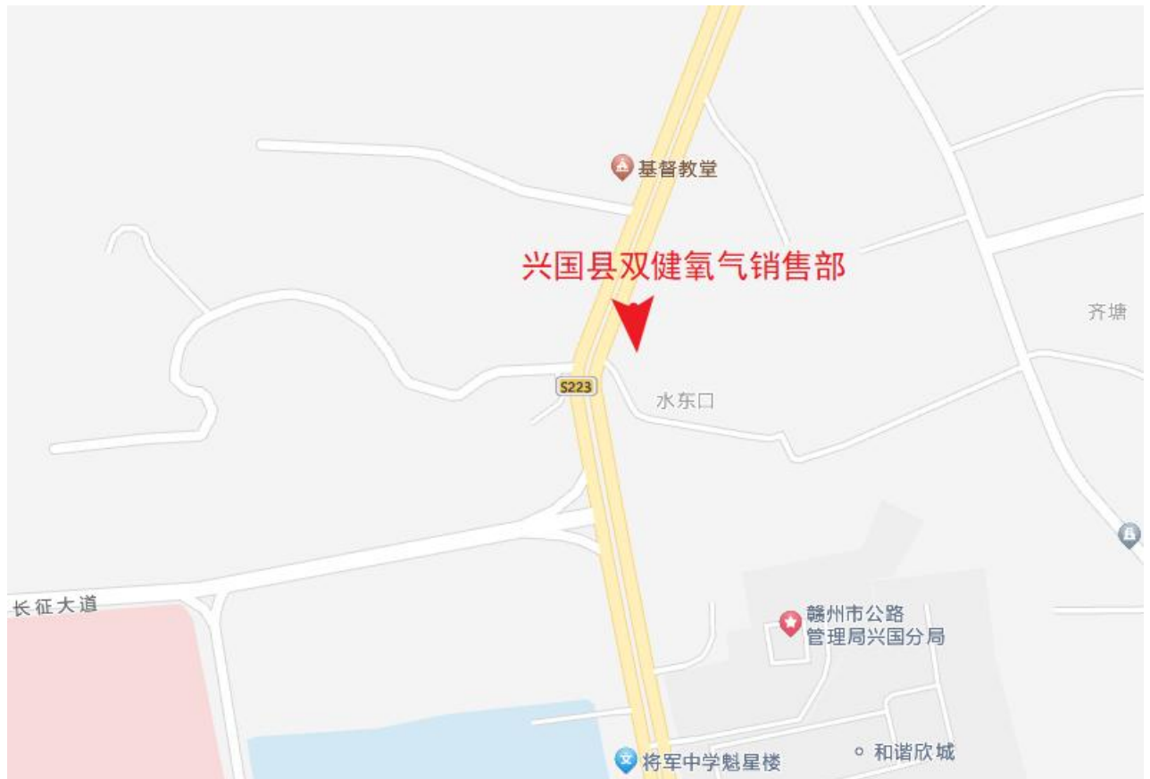
图 2-1 地理位置图

赣州市公路发展中心兴国分中心已出具证明（见附件 14），销售部西侧潏江镇将军大道北大道从将军中学至兴林加油站路段为非公路路段，因此可不按照《公路保护条例》中“第十八条 除按照国家有关规定设立的为车辆补充燃料的场所、设施外，禁止在下列范围内设立生产、储存、销售易燃、易爆、剧毒、放射性等危险物品的场所、设施：（1）公路用地外缘起向外 100 米”的要求。