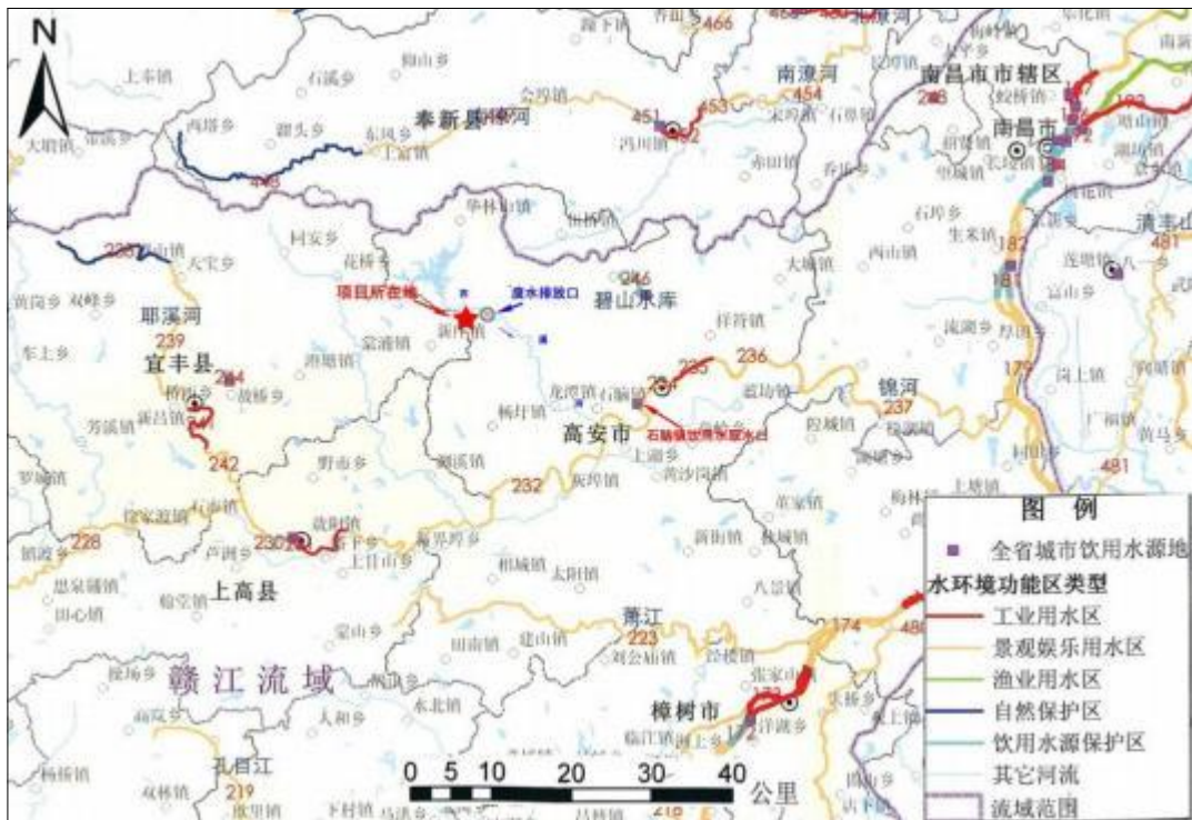
图 2-4 尾矿库所在区域水系及水环境功能区划图