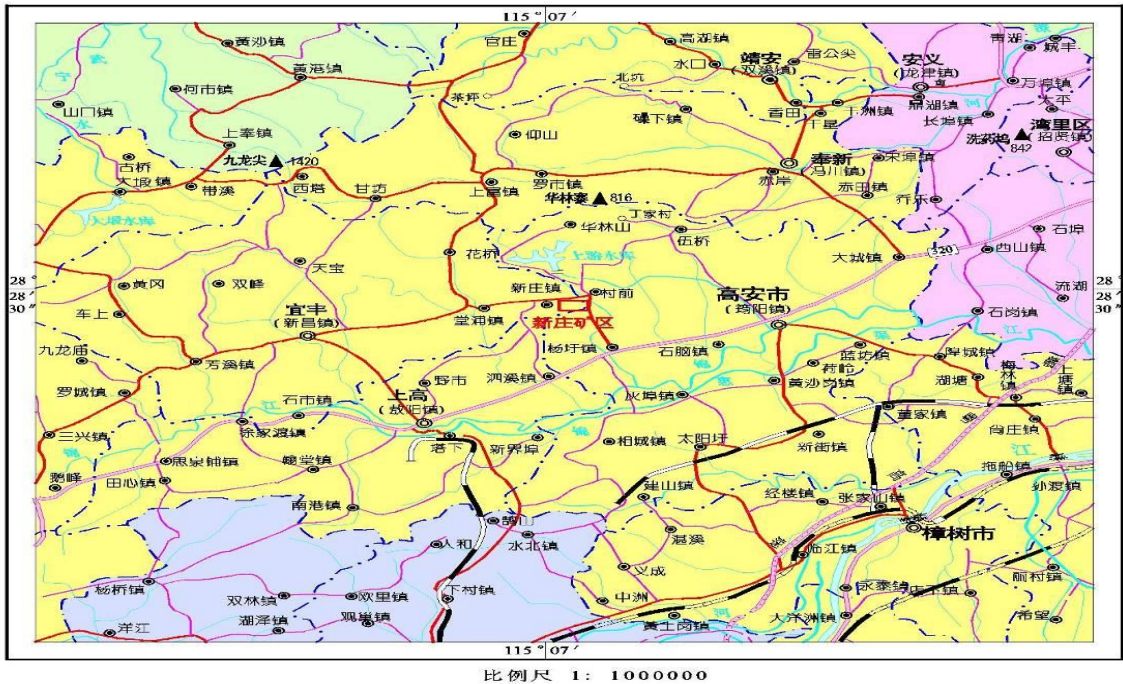
图 2-1 矿区交通地理位置图

矿库位于位于宜丰县新庄镇南东方向 140^{\circ} ，直线距离 2.5km，龙溪村与岭背村之间的岗埠地区交通地理位置见图 2-1。