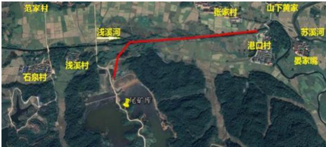
图 2-2 尾矿库下游区域状况图

根据溃坝数值模拟计算，阳坑尾矿库、阴坑尾矿库单独溃坝情况下，对周边房屋均无影响；阳坑尾矿库和阴坑尾矿库同时溃坝情况下，除浅溪村房屋处尾砂堆积厚度仅约 0.15m（堆积厚度较小，影响较小），溃坝对周边房屋均无影响。