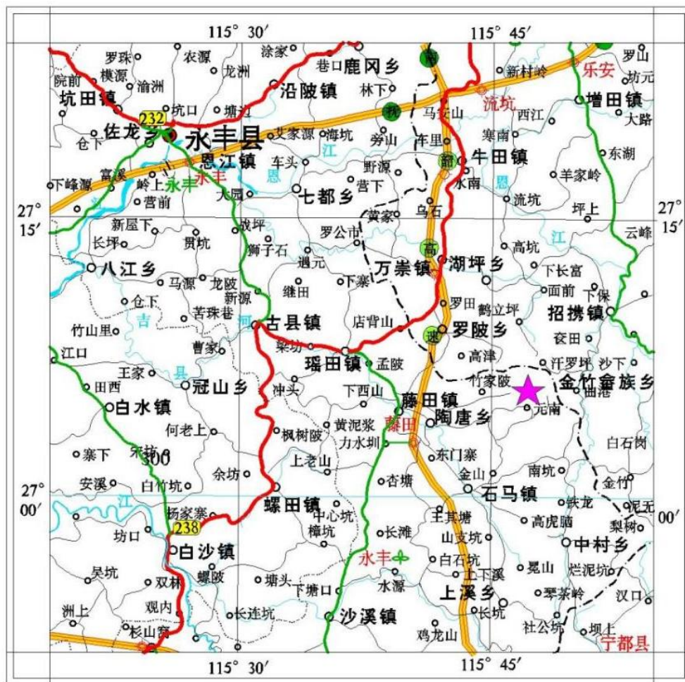
图 2-1 矿区交通位置图

矿区南西侧有简易公路（约 1.2km）与娄元村级水泥公路相连，经乡道娄元村至陶唐乡后经县道与藤田镇北省道 225 永丰县城—藤田相连，矿区至永丰县城约 54km、至抚-吉高速公路约 58km、至永丰新材料产业园约 13 公里，永丰新材料产业园距 G6011 昌宁高速永丰南收费站不到 1km，去莆炎高速公路约 62km，至永丰县城距京九铁路线八都站及 105 国道约 26km，经国道 232 永丰至吉水八都、距离最近国道 238 约 22km、永宁公路过境而过，交通较便利。矿区交通位置见图 2-1。