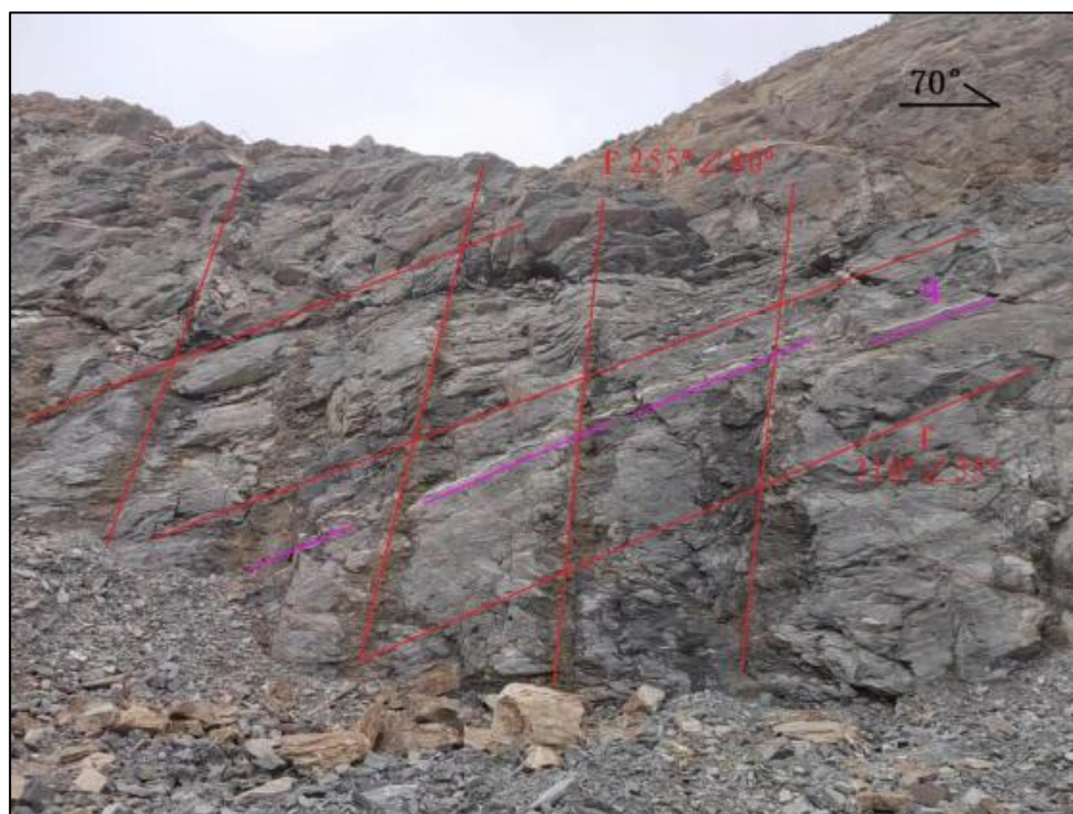
图 2-3 矿区节理裂隙特征

区内未见明显的断裂构造，区内上施组地层呈简单的单斜构造展布，走向 200^{\circ}\sim 230^{\circ} ，倾向北西。岩层中主要发育两组节理裂隙，主组为顺层裂隙，其产状与地层产状整体一致，产状 290^{\circ}\sim 320^{\circ}\angle 30^{\circ}\sim 40^{\circ} ，裂隙密度 1~3 条/m，沿裂隙中见后期石英脉充填，脉幅 0.5cm~10cm 不等（见图 2-3）；次组为产状 240^{\circ}\sim 270^{\circ}\angle 65^{\circ}\sim 85^{\circ} ，裂隙密度 0.5~1 条/m，裂隙延伸较长，裂面较粗糙，见少量泥质及铁锰质充填其中。