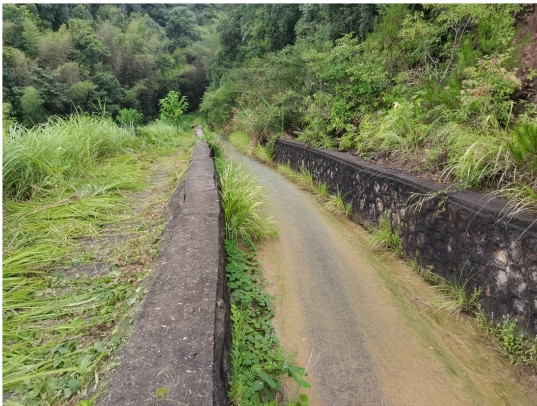
图 2-10 溢洪道下游泄流段