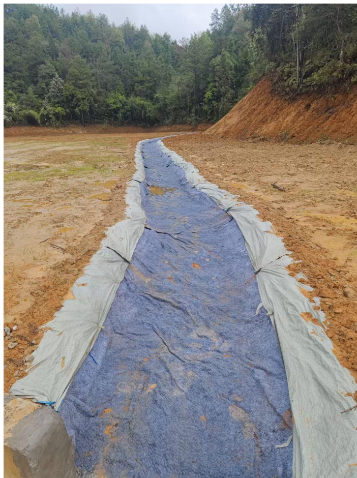
图 2-25 库区整治及维护设施现场图片 4（库尾部分滩面排水沟改为水泥毯）