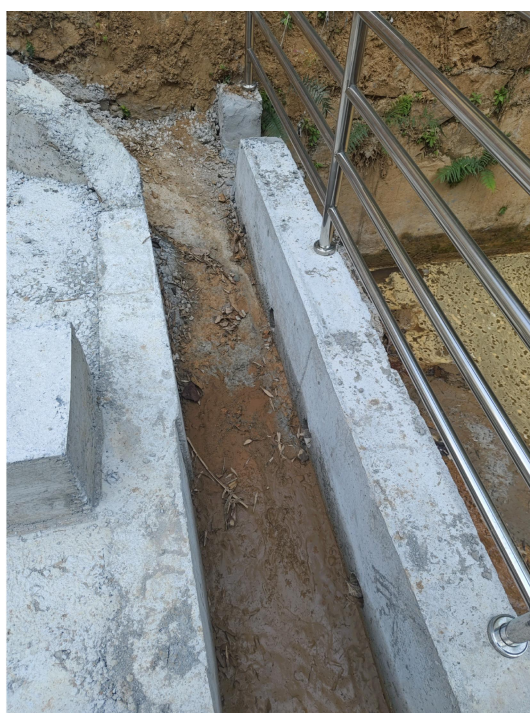
图 2-16 坝脚集渗沟

⑤在坝脚增设了集渗沟，集渗沟采用 C25 钢筋混凝土结构，矩形断面，尺寸为 B \times H = 0.5\text{m} \times 0.5\text{m} 。