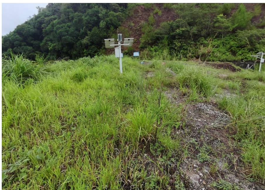
图 2-5 拦挡坝坝顶

370.2m, 坝底高程 348.8m, 现状坝高 21.4m, 坝顶宽 4.1m, 下游分别于 355.2m、338.2m 高程设马道, 其中 355.2m 高程马道宽 4.19m~6.61m, 338.2m 高程马道宽 2.29m, 拦挡坝 335.2m~370.2m 高程下游坡比为 1:2.0~1:3.11, 338.2m 高程上游和下游坡比分别为 1:2.16、1:1.63, 根据工勘揭示, 坝脚未设置排水棱体, 下游坝面长满茅草, 设置有坝肩和坝面排水沟, 未见裂缝、位移、沉陷等不良地质现象。