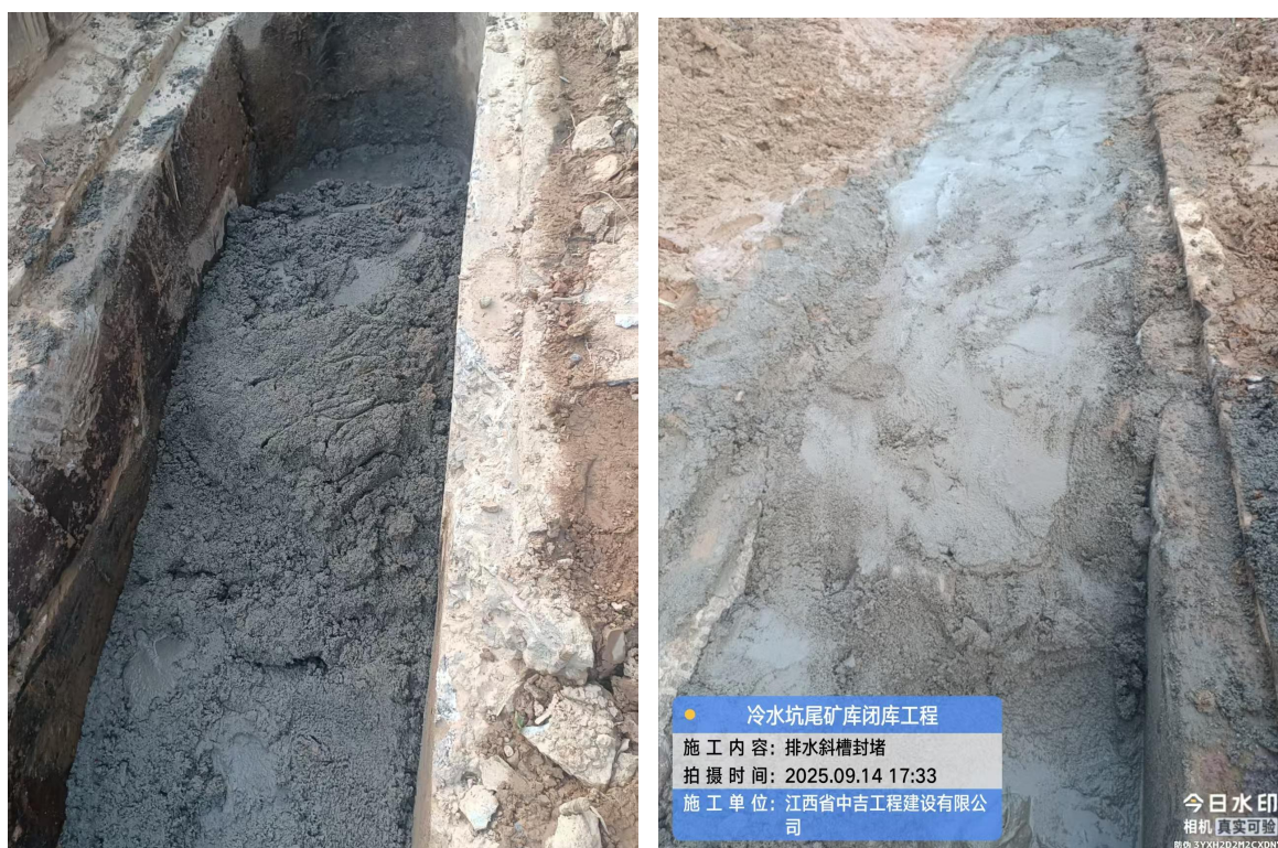
图 2-20 排水斜槽封堵