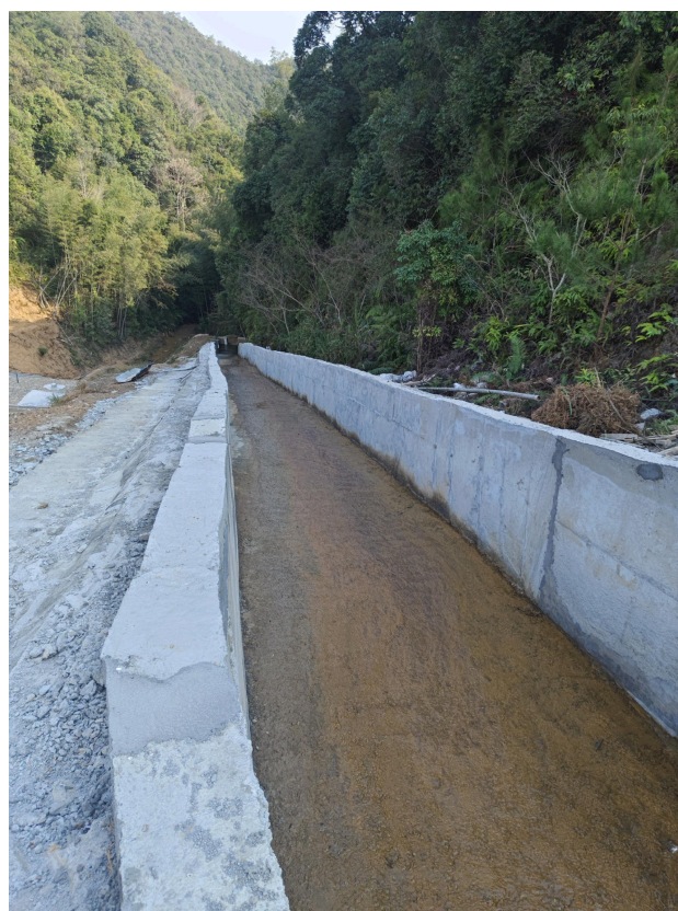
图 2-18 溢洪道下游泄流段