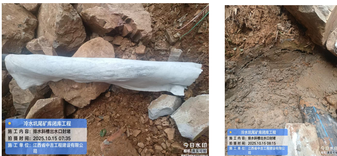
图 2-21 出口封堵