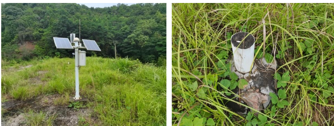
图 2-11 在线及人工监测设施

现状尾矿坝设置有在线监测设施和人工监测设施，在线监测设施主要有设置在坝顶和马道处的 4 个位移观测、排水斜槽进水口处和坝顶左坝端各 1 个视频监控、溢洪道和斜槽进水口处各设置 1 个水位观测设施；坝顶还设置有人工位移观测设施。