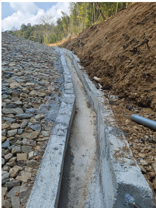
图 2-14 坝肩排水沟

体顶增设了坝面排水沟，新建坝肩沟和坝面排水沟采用 C25 钢筋混凝土结构，矩形断面，尺寸为 B \times H = 0.5\text{m} \times 0.5\text{m} ，