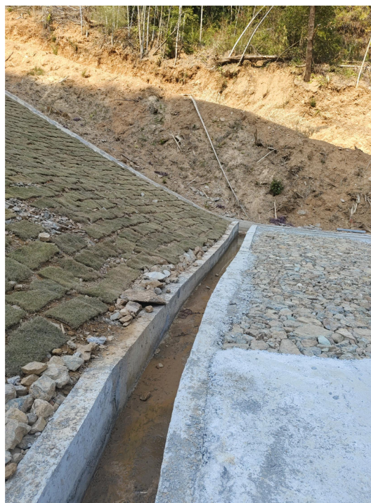
图 2-15 块石压坡坝顶坝面排水沟

⑤在坝脚增设了集渗沟，集渗沟采用 C25 钢筋混凝土结构，矩形断面，尺寸为 B \times H = 0.5\text{m} \times 0.5\text{m} 。