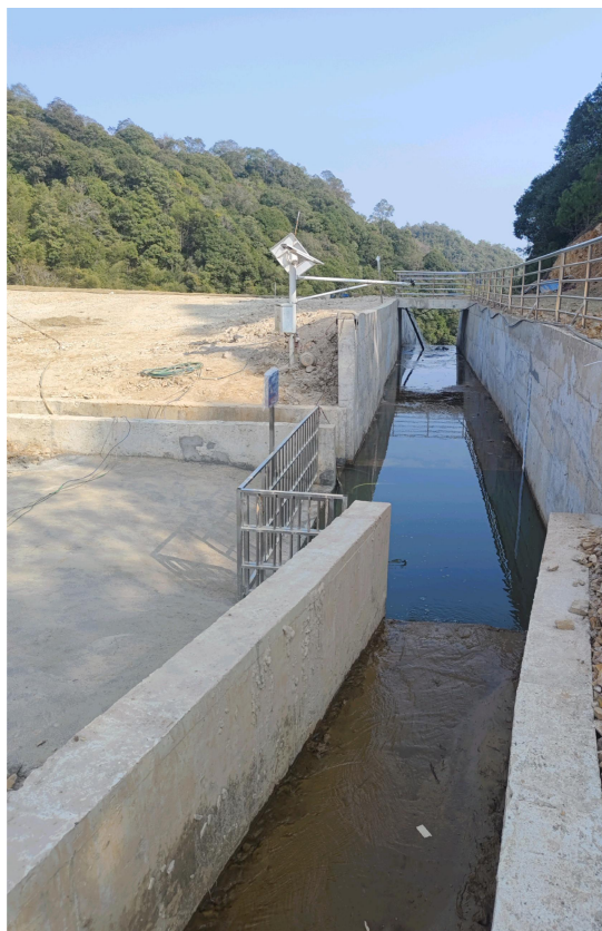
图 2-17 溢洪道进水口、库内沉砂池、护栏