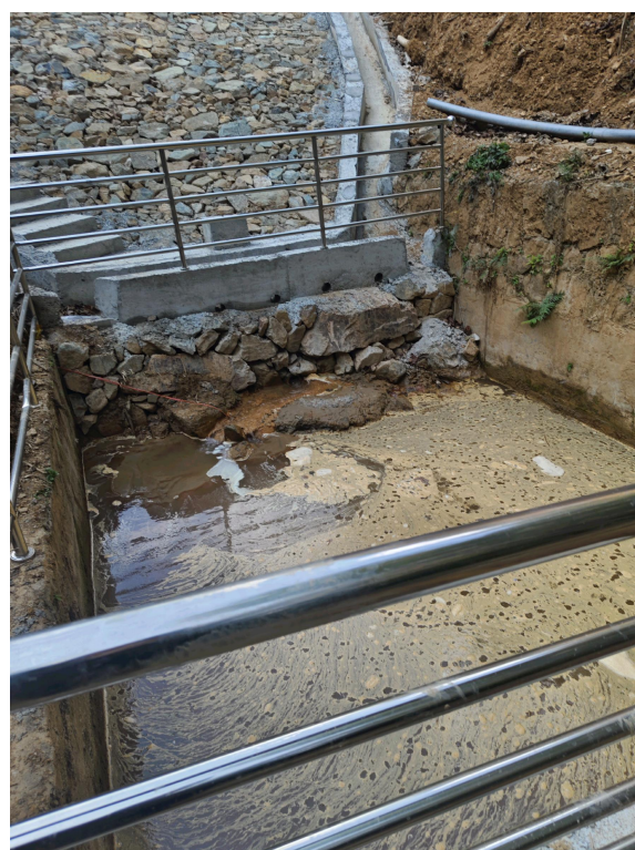
图 2-19 消力池、渗滤液收集池及护栏