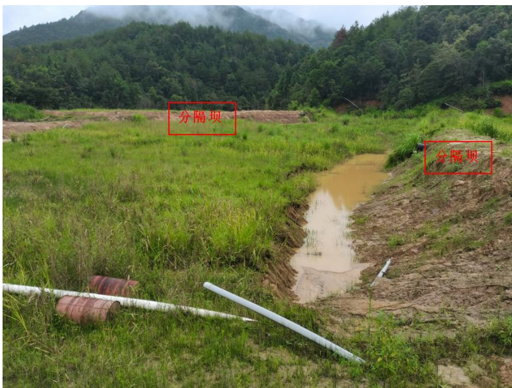
图 2-4 尾矿库库内分隔坝