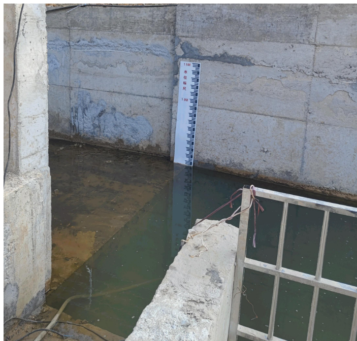
溢洪道水位观测标尺