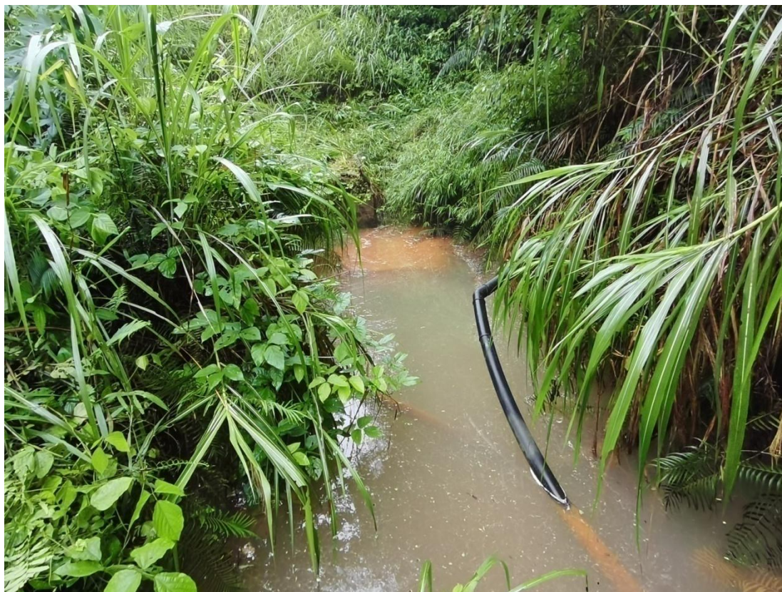
图 2-8 排水管出口