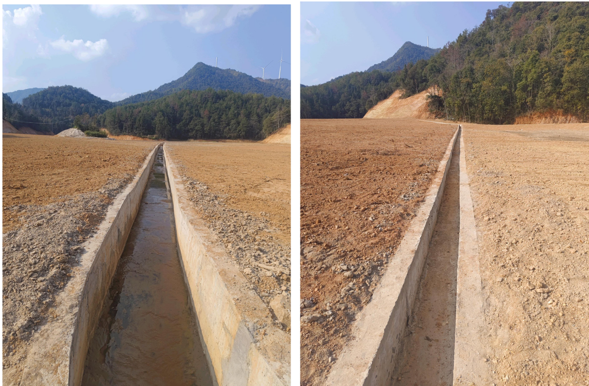
图 2-24 库区整治及维护设施现场图片 3