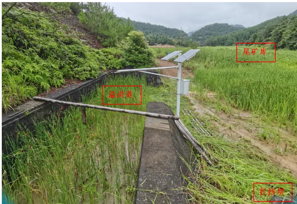
图 2-3 尾矿库现状图（坝上看向库尾）

程已达到 375.0m，库尾高、坝前低，库中采用尾砂堆筑有 3 座分隔坝，分隔坝顶高程从下游往上游分别为 372m、374m、376m，库尾及各分隔坝均有积水。