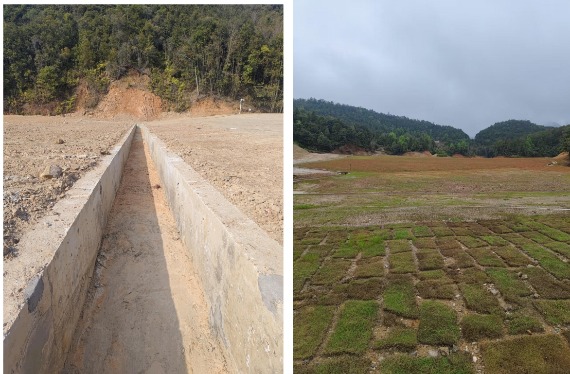
图 2-22 库区整治及维护设施现场图片 1