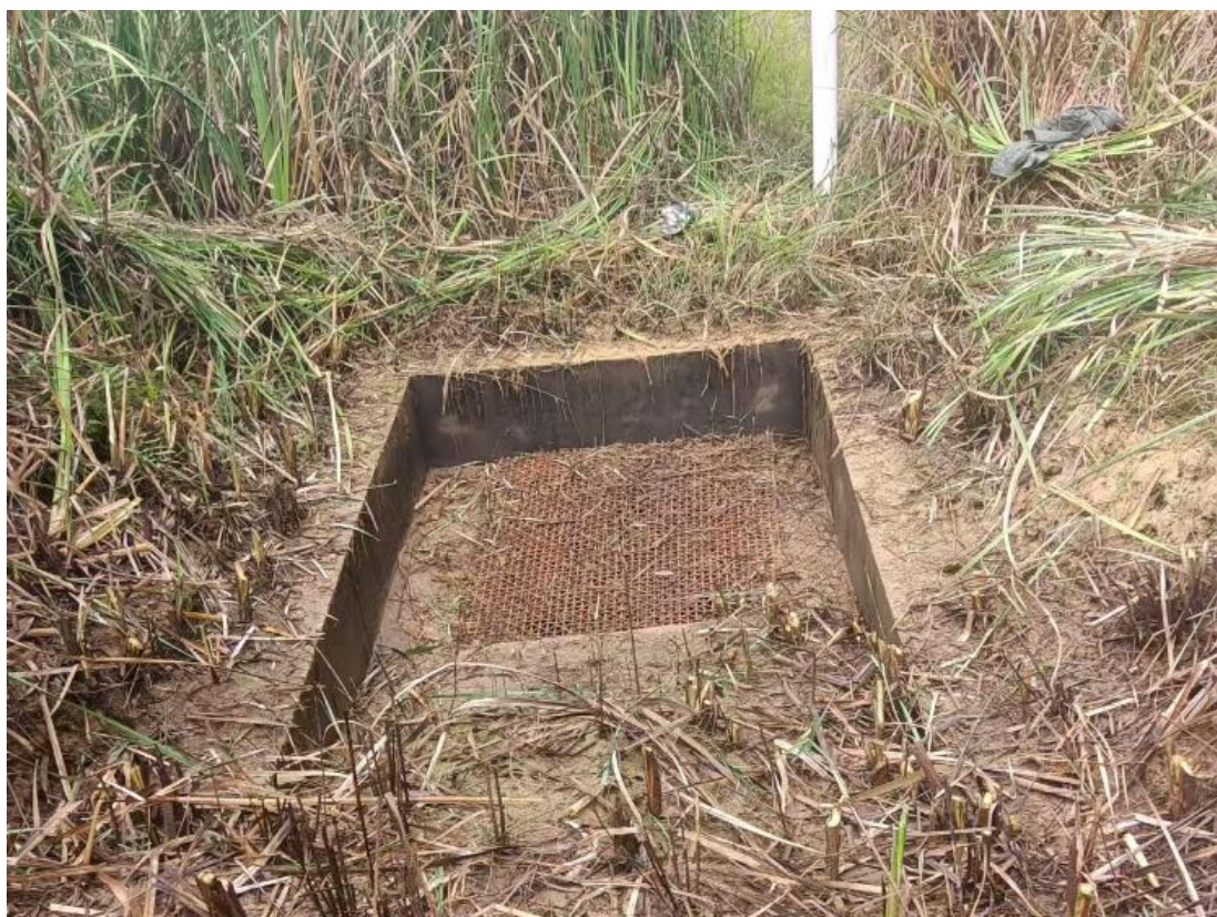
图 2-7 排水斜槽进口

冷水坑尾矿库现在正在使用的库内排水系统为：单格排水斜槽+连接井+排水管+消力池，排水斜槽位于尾矿库左岸，进水口设置有钢筋网，防止杂物进入，排水管出口位于拦挡坝坝脚，出口有水流出。排洪系统为设置在右坝肩的侧槽式溢洪道，溢洪道采用浆砌块石结构，溢洪道侧槽宽 8.0m，堰顶高程为 367.6m，堰宽 3.3m，堰内底高程 367.3m，侧壁高 2.0m，下游泄流段宽 3.3m，侧壁高 1.5m，下游泄流段出口接消力池。溢洪道进口处长满茅草，局部有裂缝与磨蚀。