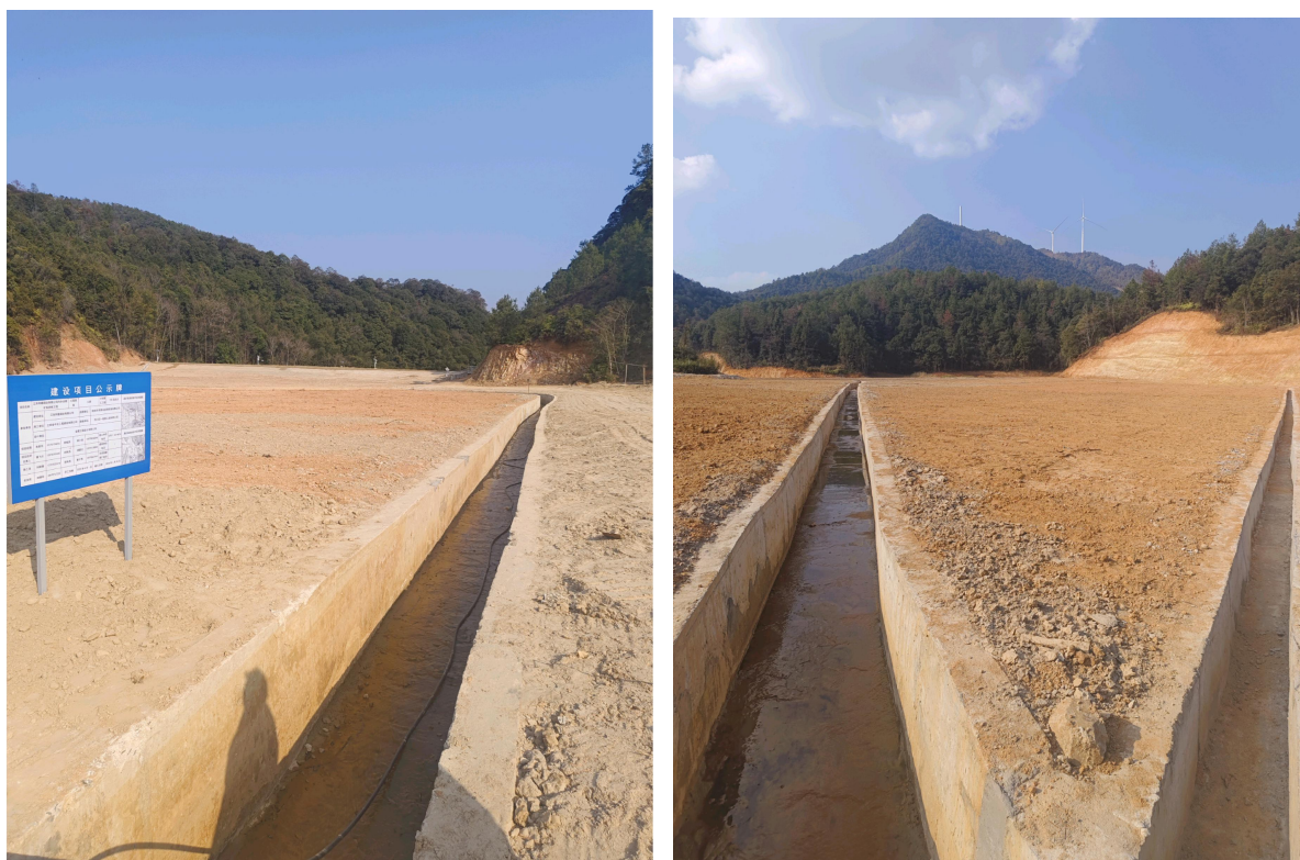
图 2-23 库区整治及维护设施现场图片 2