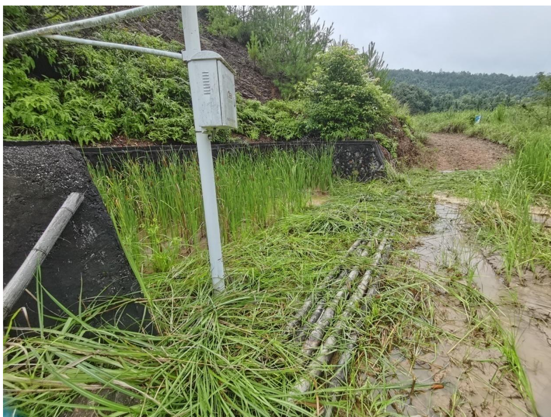
图 2-9 溢洪道进水侧槽