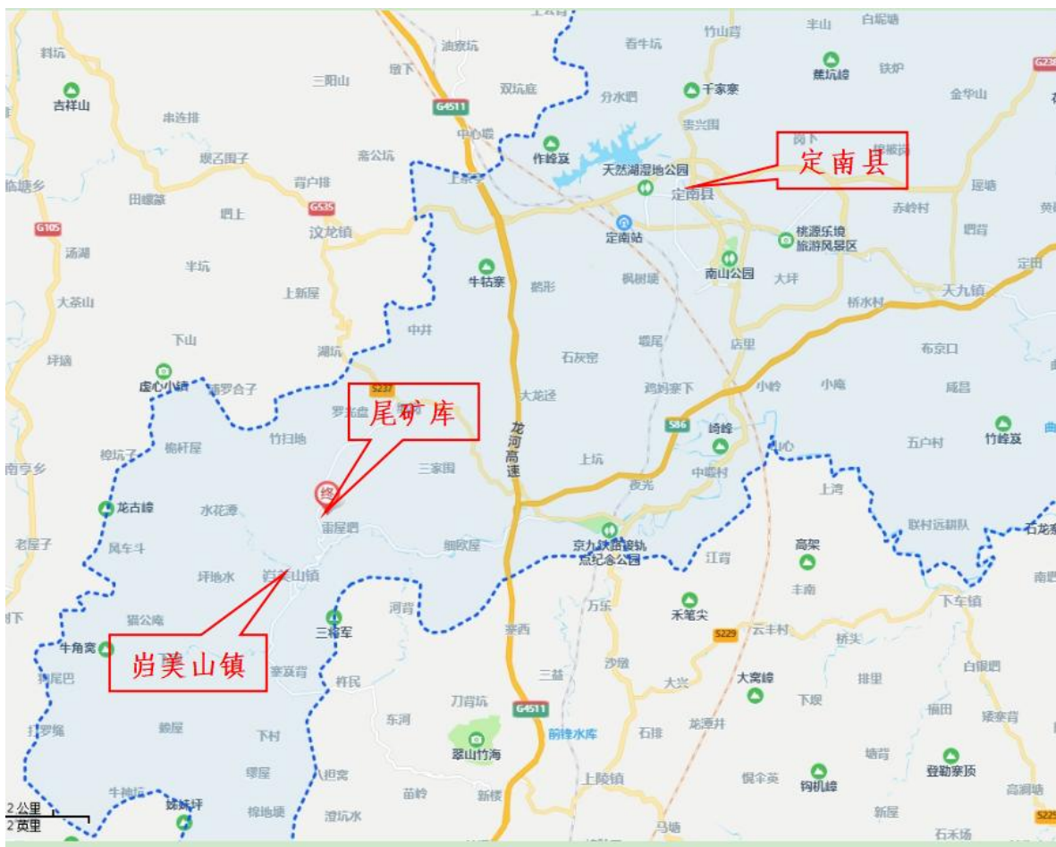
图2-1 尾矿库地理位置